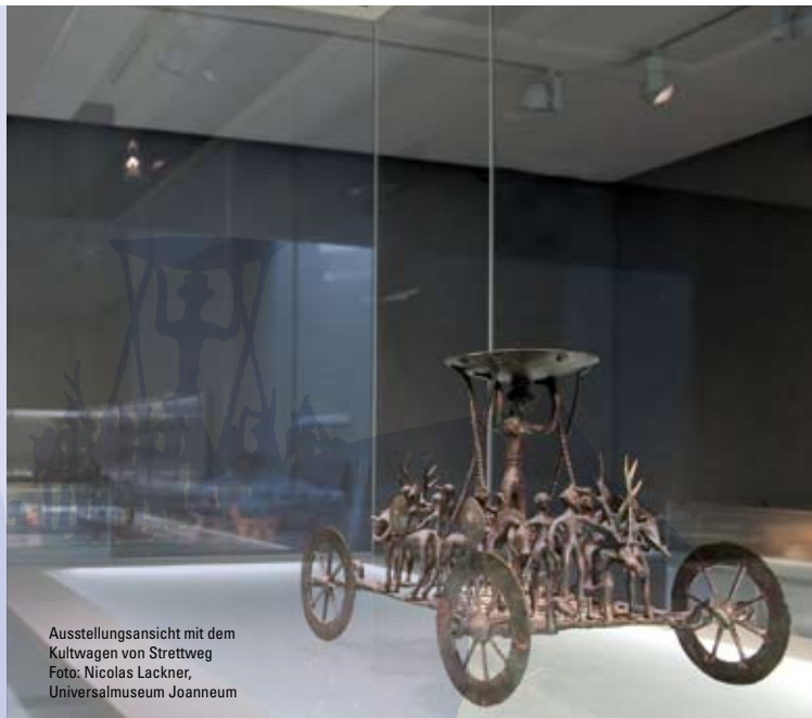
Ausstellungsansicht mit dem Kultwagen von Strettweg

Vor genau 200 Jahren wurde das Joanneum von Erzherzog Johann gegründet, und bereits damals waren die archäologischen Fundstücke ein wichtiger Teil des Museums. Verlauf: 10 Uhr Führung durch Archäologiemuseum und Lapidarium, Mittagspause, 14 Uhr: Führung durch das Münzkabinett. Treffpunkt: 10 Uhr Eingang Schloss Eggenberg, Kosten: EUR 10,- (Tageseintritt und Führungen), Mitglieder und Kinder/Jugendliche: EUR 6,-. Anmeldung erforderlich!