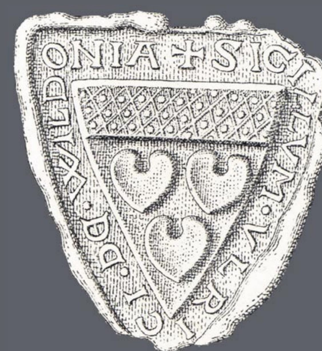
Siegel Ulrichs von Wildon, 1242. Die Damaszierung oben meint Silber, die drei Seeblätter unten stehen für Grün.

Von den Kalksteinbrüchen am Schlossberg stammt nicht nur das Baumaterial für die örtlichen Burgen – noch im 16. und 17. Jahrhundert wurden hier Steine für die Grazer Festung gebrochen und auf der Mur nach Norden transportiert.