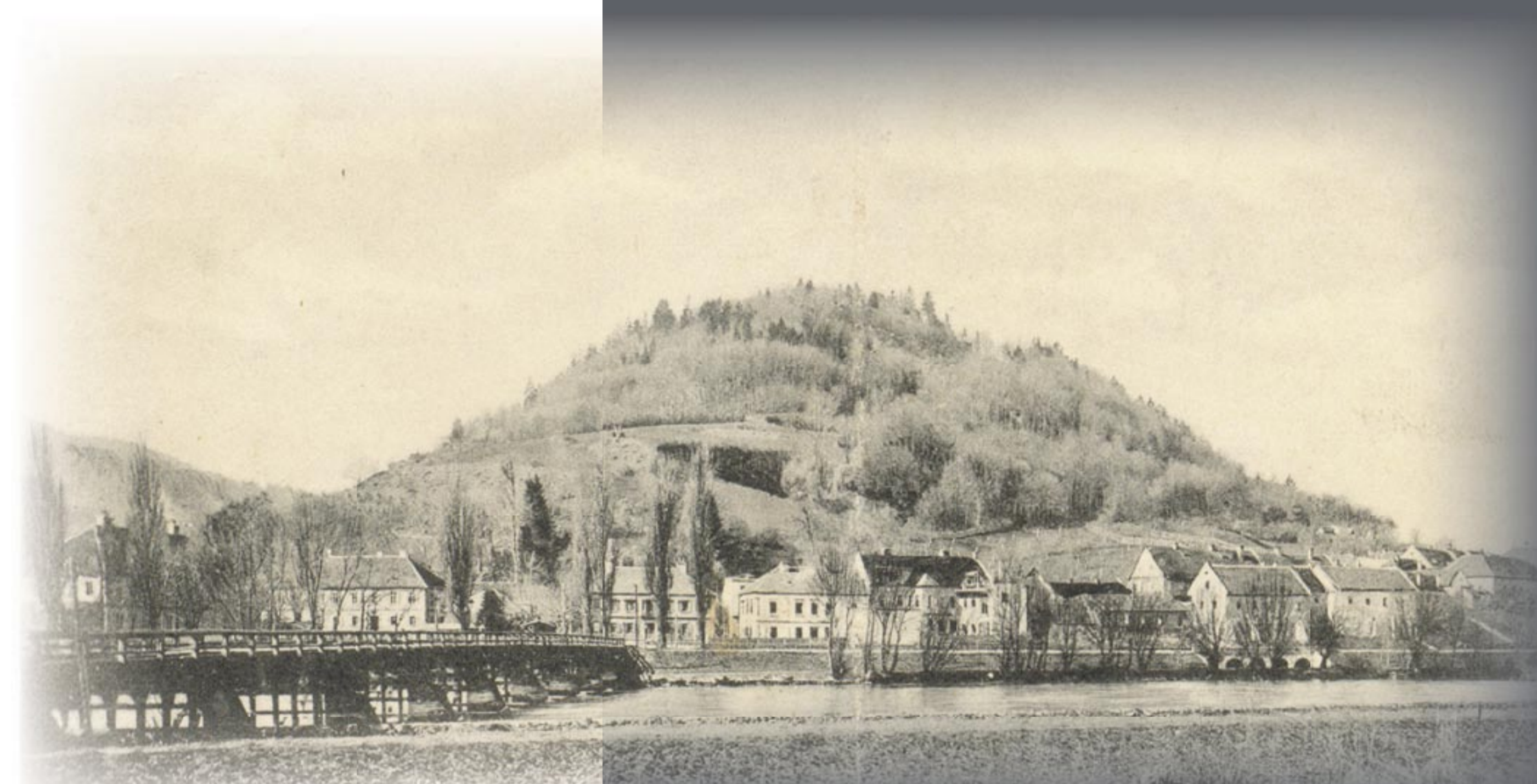
Der schütter bewaldete Schlossberg mit der Murbrücke, um 1910. MG Wildon