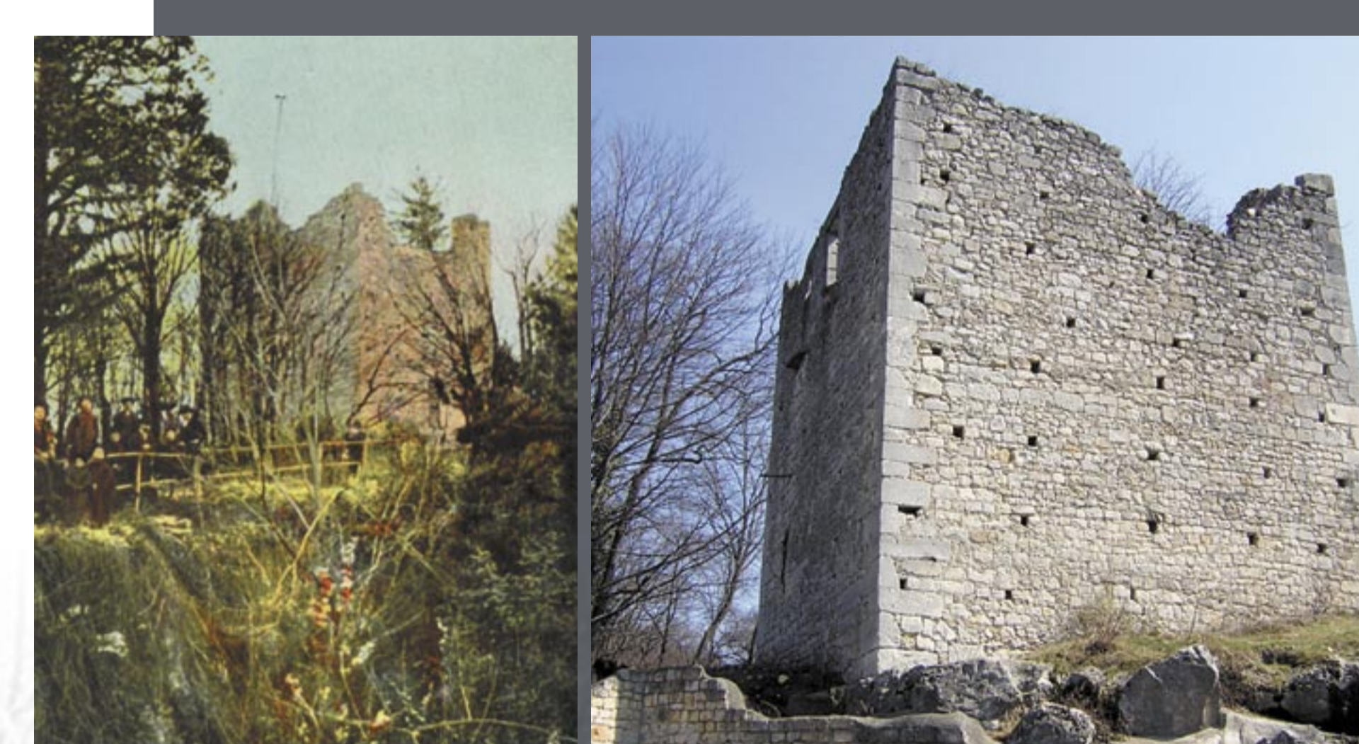
Der sog. „Heidenturm“ der Burg Wildon auf einer historischen Postkarte (um 1910) und einer Fotografie des Jahres 2002.