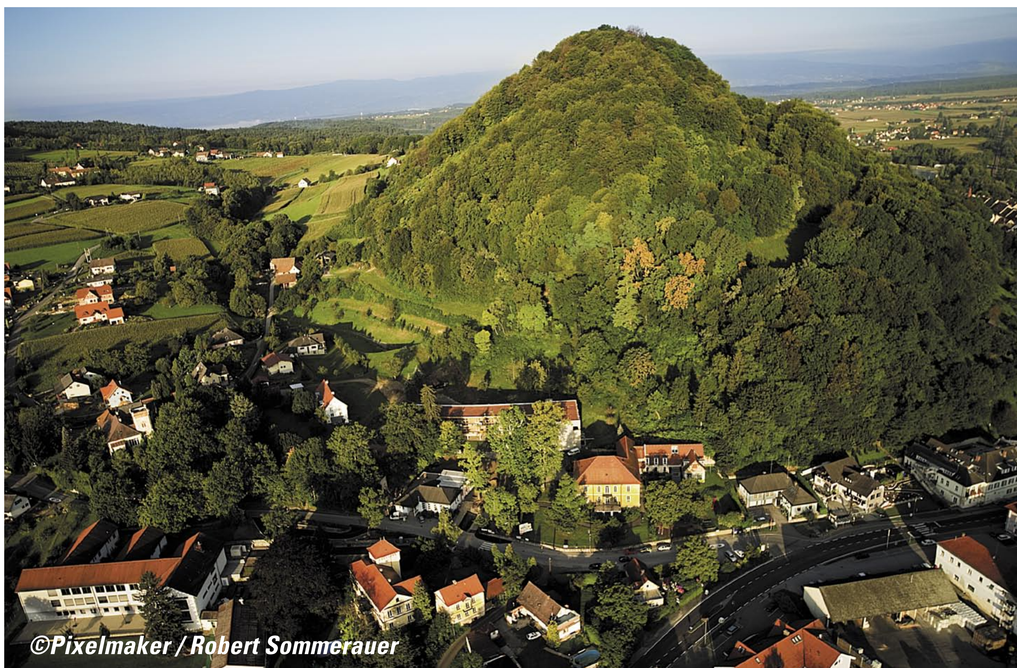
Hengist Wanderweg / Etappe Wildon